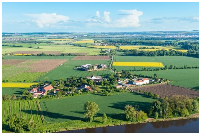
Dušníky n/Vlt – pohled od severu