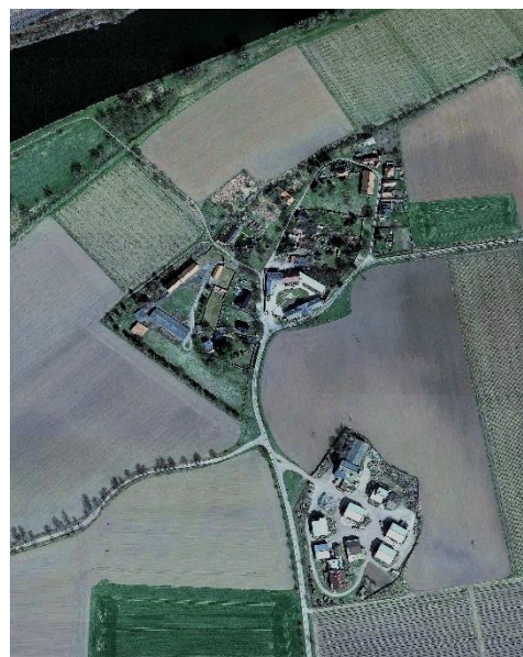
m.č. Dušníky nad Vltavou (2016)