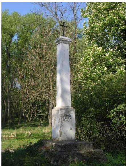
Křížek ve Všestudech

Dalšími dochovanými pietními stavbami je křížek z roku 1829 a Pomník padlých z I. a II. světové války.