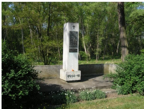
Pomník padlých z I. a II. světové války ve Všestudech