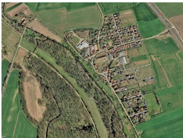
m.č. Všešudy (2016)