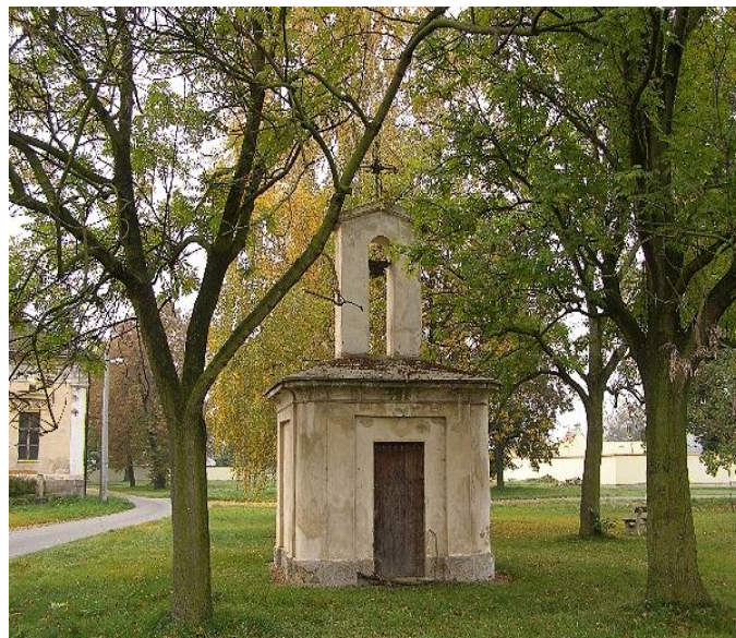
Zvonička v Dušníchách n/Vlt.

Dalšími dochovanými pietními stavbami je křížek z roku 1829 a Pomník padlých z I. a II. světové války.