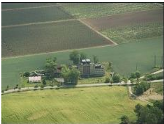
Bývalá sušárna chmele

Významnou stavbou je bývalá sušárna chmele poblíž dálnice D8. Budova byla v minulých letech předmětem podnikatelského zájmu, který však zůstal nenaplněn. Jedná se o brownfield (nevyužívané a chátrající budovy, průmyslové a hornické, zemědělské a jiné, které ztratily své původní využití).