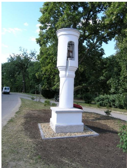
Zvonička ve Všestudech

V obci Všestudy s místní částí Dušníky nad Vltavou se dochovaly obecní zvoničky. Všestudská byla v roce 2007 opravena a u dušnické zvoničky oprava právě probíhá s předpokládaným termínem dokončení v první polovině roku 2019.